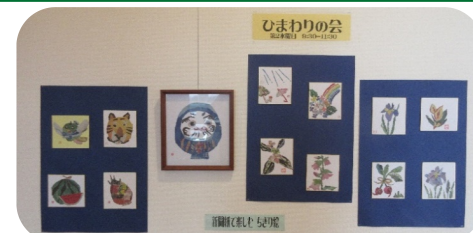
※写真は、R5年に展示した作品になります。

湖山地区公民館内★ギャラリーこやま★ 10月1日(火)～10月31日(木) 「ひまわりの会」のみなさんの作品を展示 しています。 素敵な作品をぜひごらんください♡